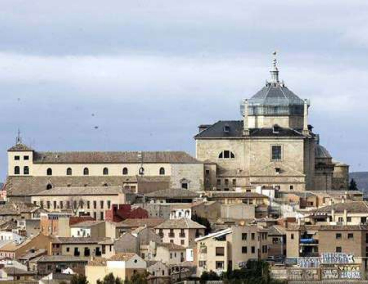
La Junta declara BIC al Hospital de Tavera