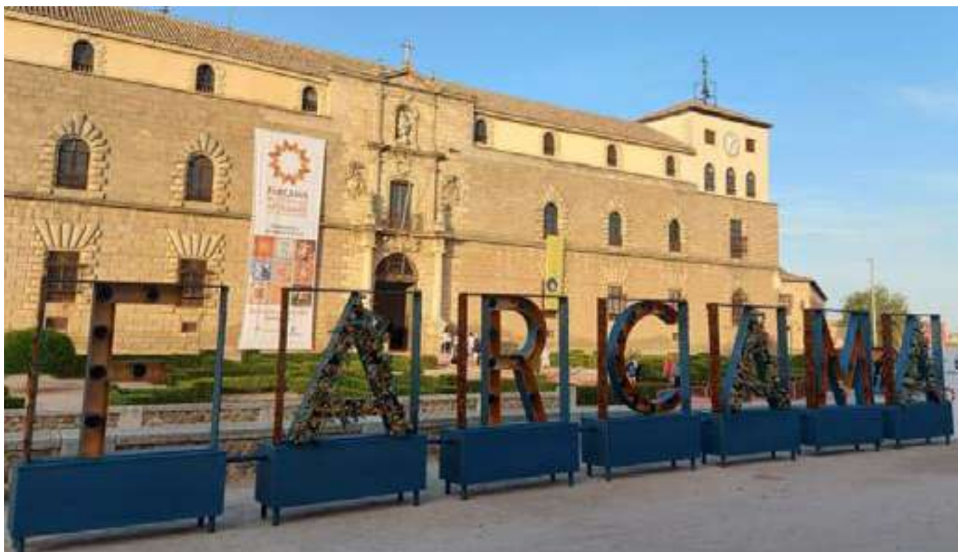
Farcama 2022 en Toledo.

En 2020 se cumplían 40 años de FARCAMA, pero la crisis sanitaria provocada por la Covid-19 obligó a posponer la Feria. Llegamos a 2021 para celebrar la XL edición de FARCAMA en el Paseo de La Vega.