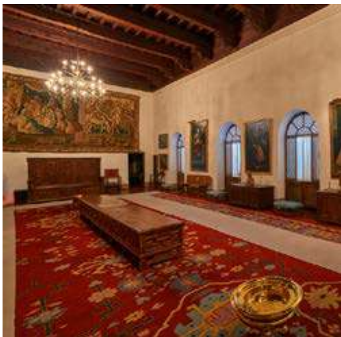
Hospital de Tavera de Toledo